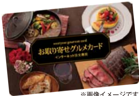
※画像イメージです。